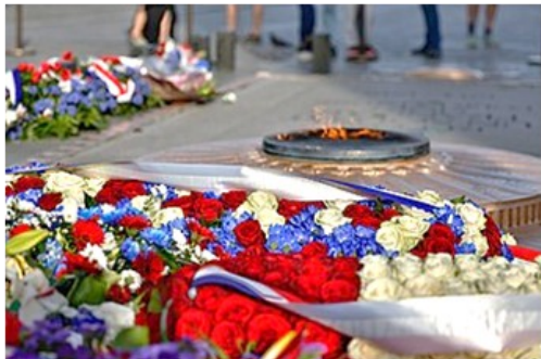
Dépôt de gerbes devant la tombe du soldat inconnu