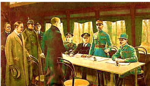
Signature de l'Armistice le 11 novembre 1918, à Rethondes

Depuis ce jour, le 11 novembre est devenu une journée de souvenir.