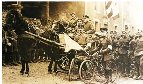
Journal Le Miroir, Le musée de l'Armée, Paris

Alors, le 11 novembre, pensons à eux , même si ce n'est qu'une minute, pour leur dire tout simplement Merci .