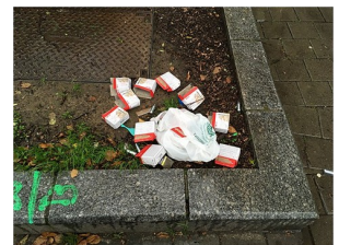
Cartouche de protoxyde d'azote à Venissieux (01/2023) - Benoît Prieur / Cartouches protoxyde d'azote, Lille, 2018 - Lamiot

Sources : www.drogues.gouv.fr ; www.francebleu.fr/infos/faits-divers-justice ; https://www.leparisien.fr/faits-divers ; https://www.ouest-france.fr/sante Crédit photos : https://commons.wikimedia.org