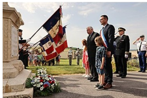
Cérémonie du Souvenir

Dans chaque ville ou village, les habitants qui le souhaitent participent aux cérémonies du souvenir : ils se rassemblent et se recueillent devant le monument aux morts sur lesquels sont gravés les noms des habitants morts à la guerre, le maire fait un discours, des enfants déposent des fleurs et tout le monde observe une minute de silence pour rendre hommage à tous les soldats qui ont combattu pour défendre la liberté et la paix.