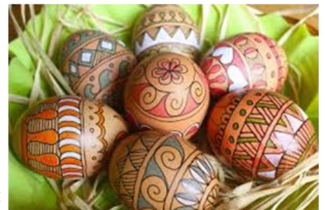
Peinture sur œufs | DOMAINE PUBLIC

Plus tard, les chocolatiers ont transformé cette tradition en fabriquant de délicieux œufs en chocolat pour le plus grand bonheur des enfants !