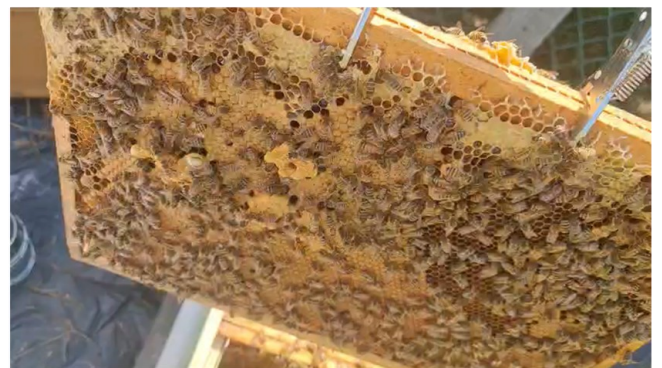
Cadre de la ruche d'Ayméric

Nous pouvons mentionner que les dégâts liés au changement climatique tels que, la modification des températures, de la fréquence des précipitations et l'augmentation des phénomènes météorologiques extrêmes influent négativement sur la population des abeilles.