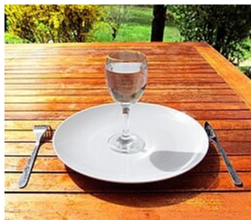
Le jeûne - Un verre d'eau dans une assiette vide—Dct Jean Fortunet 2012