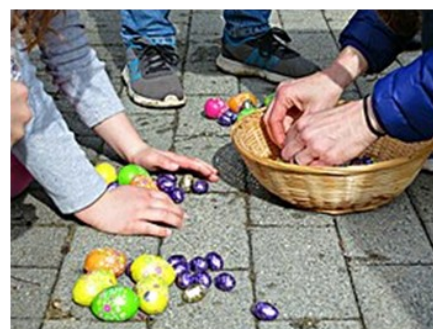
Chasse aux œufs – Ruth Hartnup 2017 Vancouver, Canada

Selon les pays, la tradition change ! En France, on raconte que les cloches des églises partent à Rome quelques jours avant Pâques. Elles reviennent le dimanche en déposant des œufs dans les jardins. En Allemagne, c'est le lapin de Pâques qui cache les œufs. Comme le lapin a beaucoup de petits, il symbolise la fécondité et la vie. Aujourd'hui, les deux traditions existent, et les enfants participent à la célèbre chasse aux œufs.