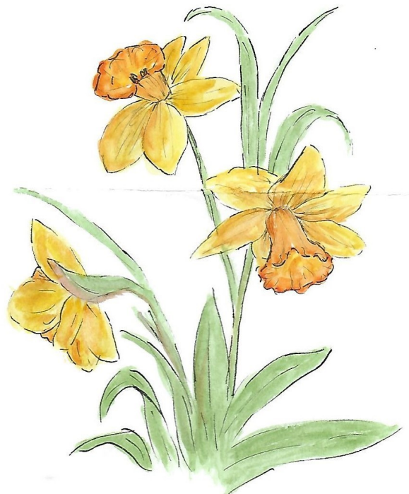
Illustration de Marguerite V. 6e