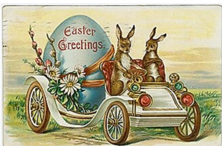
Lapin de Pâques | Easter Greetings 1907

Selon les pays, la tradition change ! En France, on raconte que les cloches des églises partent à Rome quelques jours avant Pâques. Elles reviennent le dimanche en déposant des œufs dans les jardins. En Allemagne, c'est le lapin de Pâques qui cache les œufs. Comme le lapin a beaucoup de petits, il symbolise la fécondité et la vie. Aujourd'hui, les deux traditions existent, et les enfants participent à la célèbre chasse aux œufs.